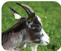
CHÈVRE DES FOSSÉS