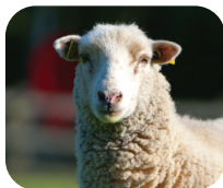
MOUTON DES LANDES DE BRETAGNE