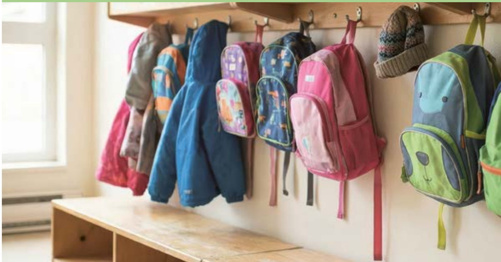
Ville du Havre - 2026