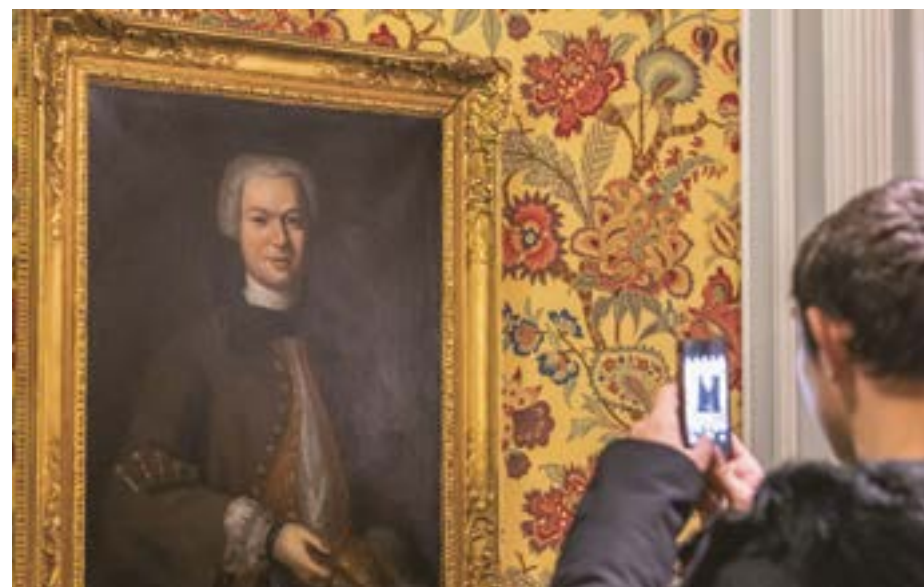
Portrait de Martin-Pierre Foäche