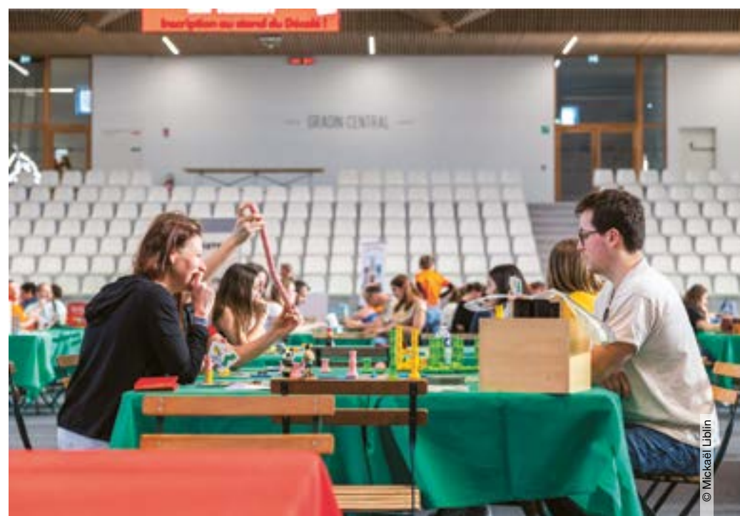
Festival du jeu 2025