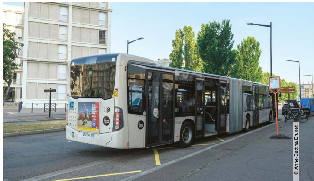
Terminus de la ligne « Plage »

Au départ de la gare (angle rue Magellan), la ligne « Plage » dessert notamment le cours de la République, le Rond-Point, les rues du Maréchal-Joffre et René-Coty, la place Thiers, l'Hôtel de Ville et l'avenue Foch, jusqu'à l'arrêt « La Plage », proche de la Porte Océane. Au retour, elle passe par Saint-Vincent, la rue Frédéric-Bellanger,