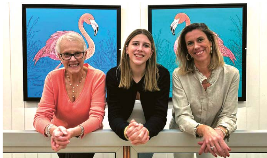
Trois générations de la famille Hamon

Galerie Hamon – 44, place de l'Hôtel-de-Ville Exposition anniversaire visible jusqu'au 2 septembre Vernissage le vendredi 10 juillet à partir de 18 h