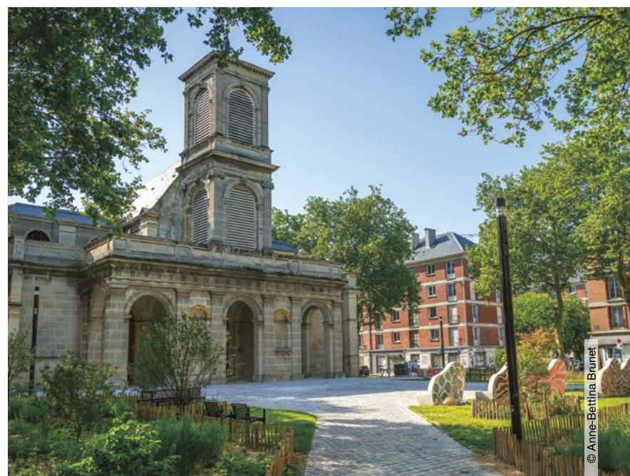
La place du Père-Arson

Entre tradition maritime et transformation urbaine, Saint-François évolue. Tandis que la Fête de la mer fait vibrer son identité portuaire, le quartier se réinvente avec des espaces plus ouverts, plus verts et plus propices à la flânerie, tournés vers le quotidien comme vers la mer.