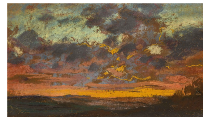
Claude Monet, Coucher de soleil, vers 1868, pastel sur papier, 21 x 35 cm, collection particulière

Au MuMa, l'exposition « Monet au Havre » vous invite à découvrir l'œuvre de jeunesse d'une figure majeure de l'impressionnisme. Claude Monet est né à Paris, mais c'est au Havre qu'il grandit ! Il a cinq ans lorsque sa famille s'installe dans la cité portuaire. C'est là que le jeune homme découvre le dessin. L'exposition présente deux de ses premiers carnets de dessin, qui datent de 1856 et qui n'ont jamais été présentés au public. C'est en compagnie du peintre de 16 ans son aîné, Eugène Boudin, que Claude Monet découvre la peinture en plein air, toujours au Havre. À Rouelles, il exécute sa première toile, également présentée dans l'exposition. Cette œuvre est exceptionnellement prêtée par le musée japonais qui la conserve habituellement. Elle sera à découvrir jusqu'au 27 septembre 2026 au MuMa.