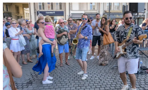
© Anne-Bettina BRUNET, Ville du Havre